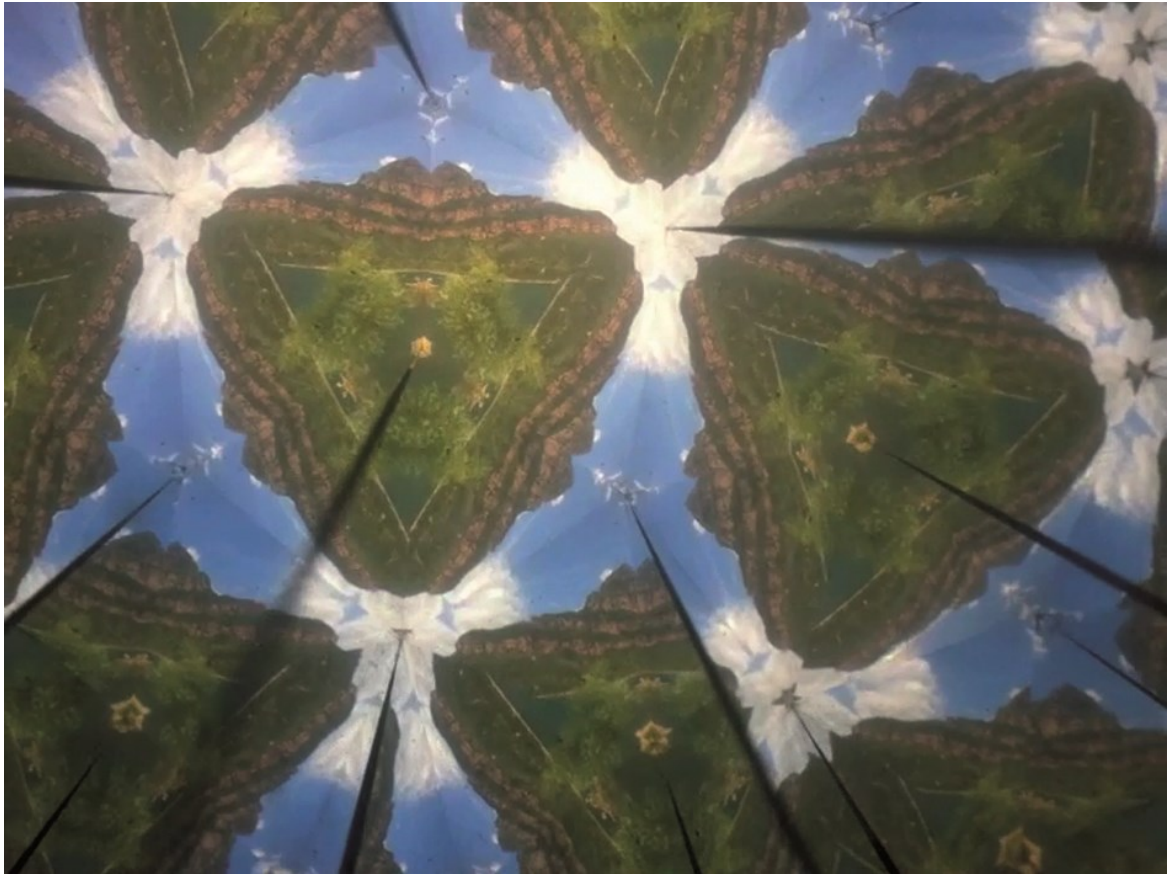
ALEXANDRE JOLY Kaleidoscopic China Landscape , 2013 Vidéo 18 min 41 sec. loop (film still)