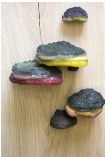
Flurina Badel/Jérémie Sarbach, Xylobiont Family (Aggregation) , 2016, sculpture (detail)

Contact presse: anne.jeanrichard@villedemartigny.ch | 027 721 22 39